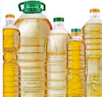
MINYAK GORENG KETERSEDIAAN: 161,08 TON KEBUTUHAN: 157,28 TON