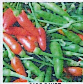
CABE RAWIT KETERSEDIAAN: 40,00 TON KEBUTUHAN: 29,85 TON