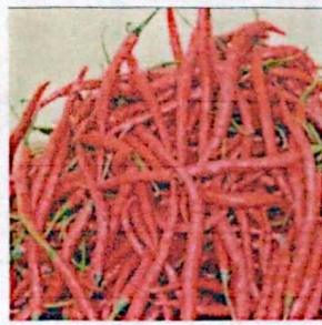
CABE MERAH KETERSEDIAAN: 83,33 TON KEBUTUHAN: 71,46 TON