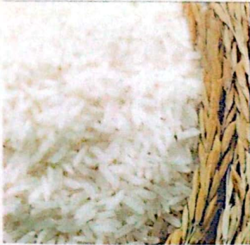
BERAS KETERSEDIAAN: 1.245,11 TON KEBUTUHAN: 1.236,31 TON

Sistem Monitoring Stok Pangan Pokok Strategis Mencakup Data dan Informasi Ketersediaan dan Kebutuhan Stok Kabupaten Rokan Hulu Yang Dilakukan Setiap Minggu