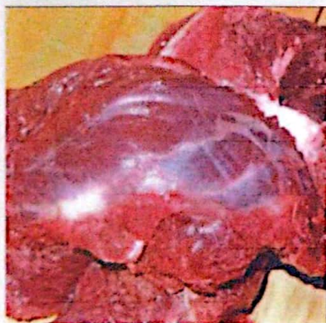
DAGING SAPI KETERSEDIAAN: 30,18 TON KEBUTUHAN: 28,48 TON