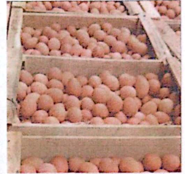
TELUR KETERSEDIAAN: 95 TON KEBUTUHAN: 94,12 TON