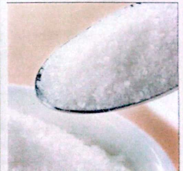
GULA PASIR KETERSEDIAAN: 99,99 TON KEBUTUHAN: 92,88 TON