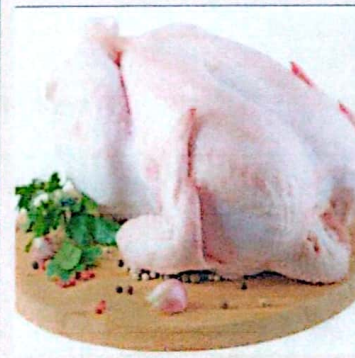
DAGING AYAM KETERSEDIAAN: 137,55 TON KEBUTUHAN: 137,46 TON