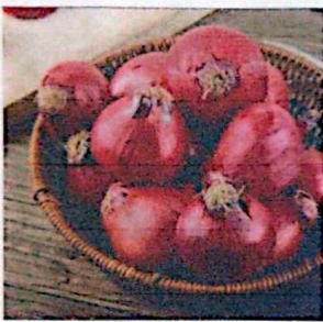
BAWANG MERAH KETERSEDIAAN: 60,06 TON KEBUTUHAN: 50,65 TON