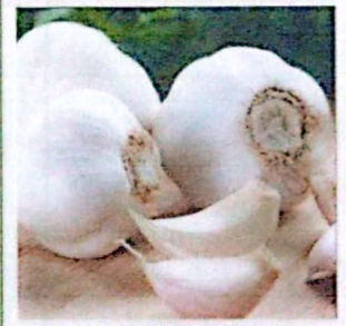
BAWANG PUTIH KETERSEDIAAN: 33,85 TON KEBUTUHAN: 20,31 TON